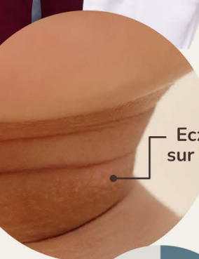
Eczéma sur le cou

De 10 à 15 % des enfants canadiens de moins de 5 ans souffrent d'eczéma