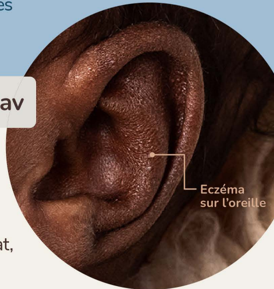
Eczéma sur l'oreille

« L'eczéma est une inflammation de la peau qui affecte le bon fonctionnement de la barrière cutanée. Cela empêche la peau de maintenir un niveau d'hydratation adéquat, et la rend ainsi plus susceptible à l'irritation causée par des facteurs externes. »